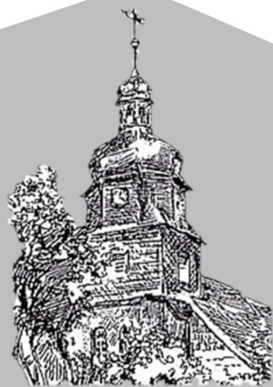
St. Marien-Kirche Wollershausen

Kirchengemeinden Gieboldehausen und Wollershausen